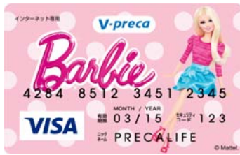
一般販売用デザイン